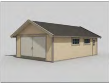
Garage Sorunda 40