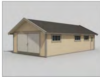
Garage Sorunda 50