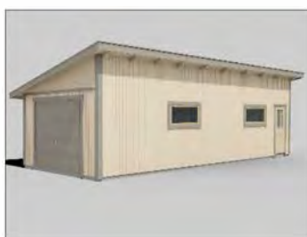
Garage 40 Pulpet