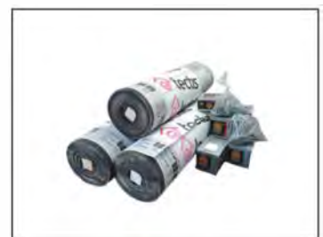
U-papp, spik, skruv